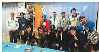
上 市民まつり 下 視察研修

9月16日(火)に当会工業部会と小平商工会・小金井市商工会の工業関係者の3市合同情報交換会を小平市で開催しました。自社PRと情報交換を和やかに、実施後も各企業のつながりがある企業も多く、実りのある事業となりました。